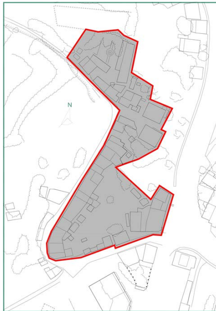
Barrio da Magdalena