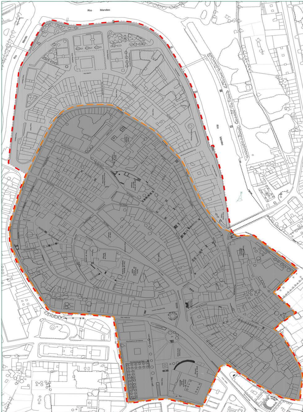
Casco Histórico e Barrio da Ribeira