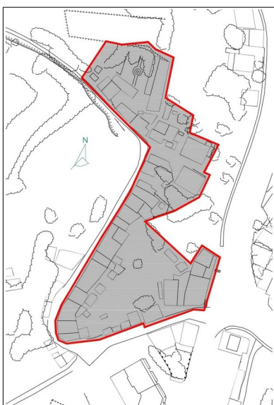
Barrio de A Magdalena